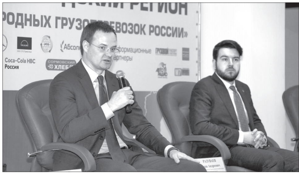
Заместитель губернатора Нижегородской области Сергей Морозов: «Площадка ТПП – это прекрасная возможность обменяться мнениями и получить для нас как для представителей власти обратную связь».

– У Нижнего Новгорода выгодное транспортное расположение, наш город находится на Транссибирской железнодорожной магистрали, на великой русской реке Волге, которая имеет